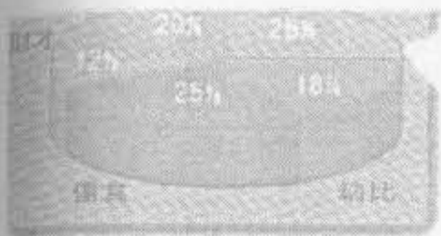
男命生育之年透十神。